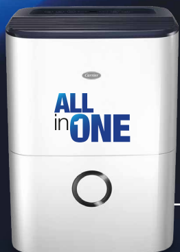
NextGen II: 16 & 20 Lt