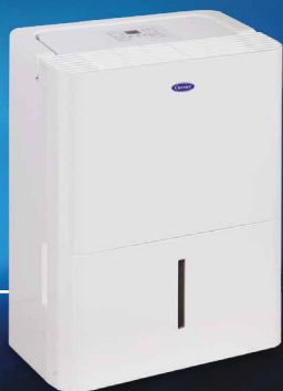
NextGen I: 10 & 12 Lt