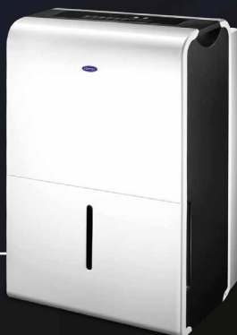
NextGen III: 30 & 50 Lt